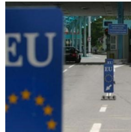
Устав на РМ, член 27

Устав на РМ, Член 9 став 2 Граѓаните пред Уставот и законите се еднакви.