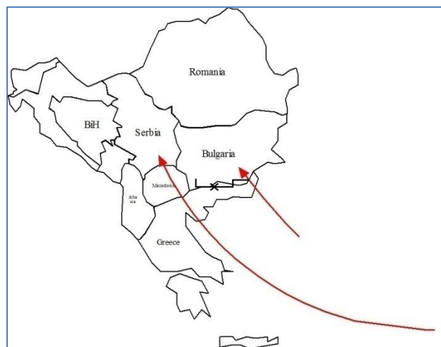
Слика 1 Мигрантски рути на Балканот во 2015 година

Мигрантската криза предизвика најголем притисок на македонските граници во текот на 2015 година. Неконтролираните бранови мигранти, кои во текот на летниот период достигнуваа од 5.000 до 10.000 лица на ден на јужната граница ја издигнаа потребата од активирање на системот на кризен менаџмент во Република Македонија. Преминувањето на повеќе од половина милион лица низ територијата на земјава неминовно влијае на зголемување на безбедносните ризици, и тоа не само на илегална миграција туку и шверц, користење на рутата за транспорт на лица со намера да извршат терористички напади на европска почва, како и превоз на борци-повратници од боиштата во Сирија и Ирак. Македонските власти поради овие причини и заради полесен транзит на овие лица низ македонска територија, водејќи се од хуман аспект издадоа документ што им овозможува на бегалците транзит за 72 часа. Како одговор на тоа, Унгарија, Словенија и Хрватска почнаа да градат нови огради што ги принудува мигрантите да ги променат правците, но исто така, и начинот на кој тие ќе влезат во земјите, бидејќи нивната крајна дестинација се земјите како Германија или Шведска. Македонската граница е една од главните точки за движење на мигрантските рути и одбивање на лажните баратели на азил (слика 11).